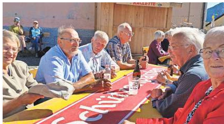
Bei herrlichem Wetter konnte die Zeit auf dem Gotthard genossen werden.