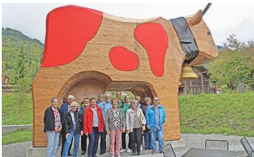
Die Ehrenmitglieder des Satus Rothrist.