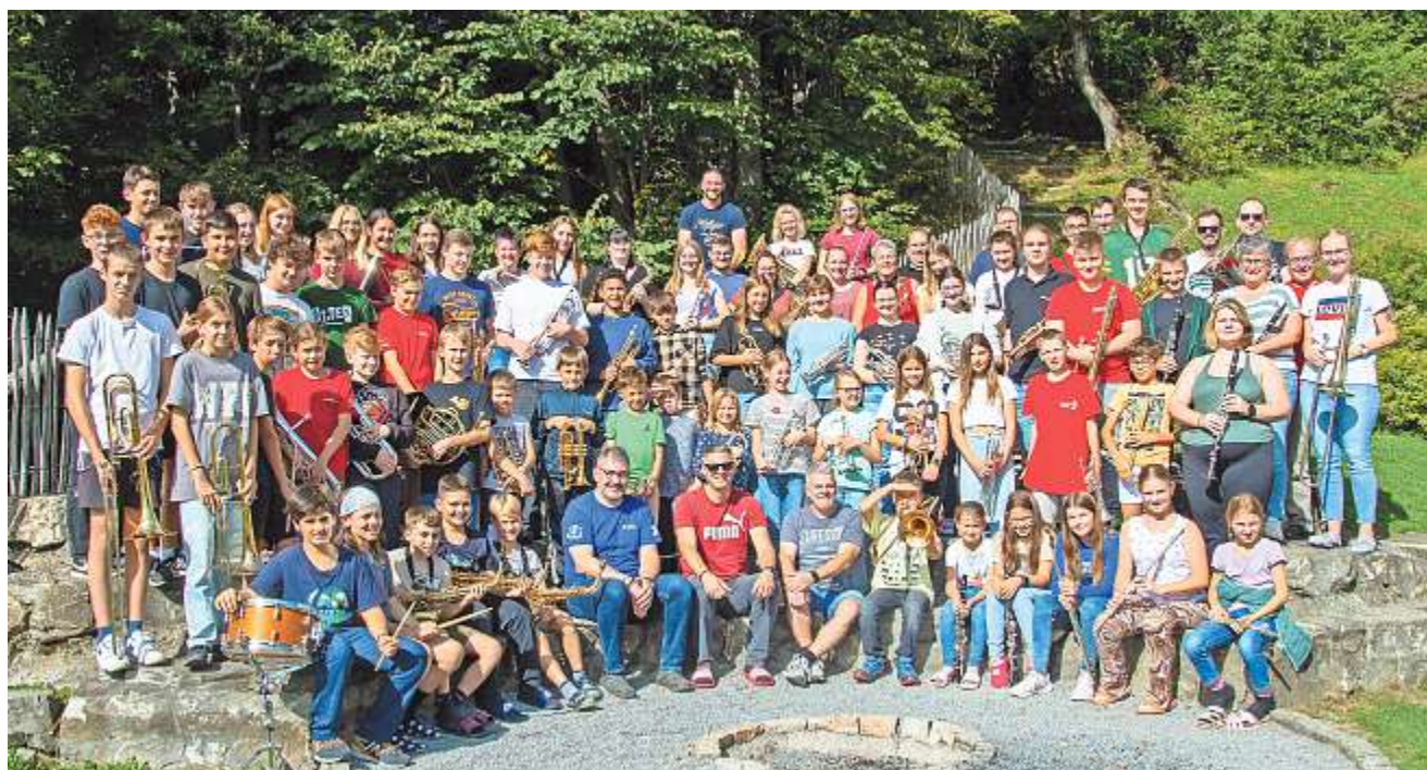
Die Teilnehmenden des Musiklager-Kisi erarbeiten ein Konzertprogramm, das sie am Freitag in Hägendorf präsentieren.

Rothrist/Hägendorf 32. Musiklager-Kisi erstmals in Hasliberg